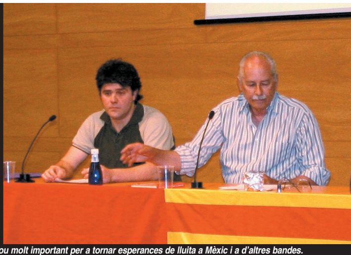
L'aixecament dels zapatistes fou molt important per a tornar esperances de lluita a Mèxic i a d'altres bandes.

"S'està construint la repotenciació de la identitat llatinoamericana com a subjecte polític propi"