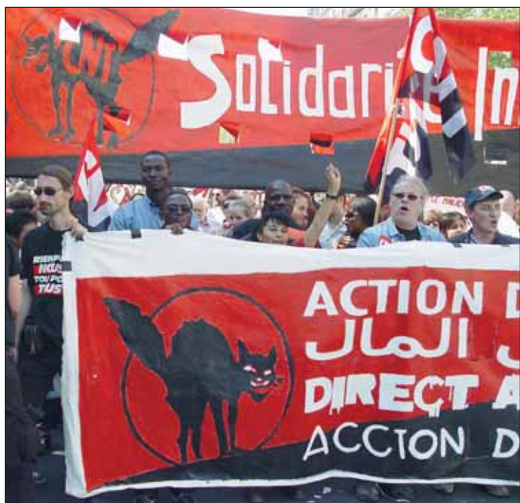
1º de mayo en París.