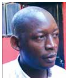
Madiop CGT Baleares

Lo más productivo han sido los 'meetings', los encuentros entre militantes de las distintas organizaciones. El hecho de que la gente se vea cara a cara en los debates y hablen sobre las situaciones de sus países y sobre las luchas que desarrollan. En cuanto a las organizaciones también es muy importante que se puedan encontrar para profundizar en sus relaciones al margen de los calendarios de movilización que marcan las empresas y los estados con sus actuaciones.