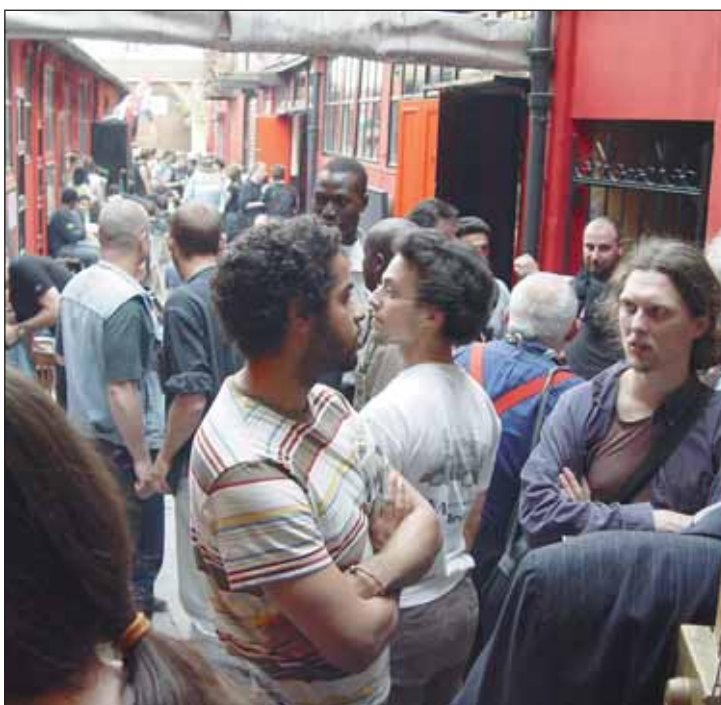
Aspecto de los locales de CNT durante los encuentros.