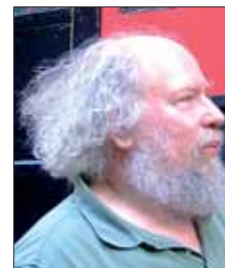
Steven INT. WORKERS OF THE WORLD - EE.UU.

Hoy, más que en otras ocasiones, tenemos una visión más clara sobre los peligros que acechan a los derechos sindicales, sobre todo en Europa. Por lo que creo que se debía impulsar la idea de un día común de lucha, dentro de la tradición de la acción directa del sindicalismo libertario, con un manifiesto común y una movilización a nivel mundial. De momento vamos a trabajar sobre la propuesta de construir una Coordinadora Anticapitalista Internacional y una página web.