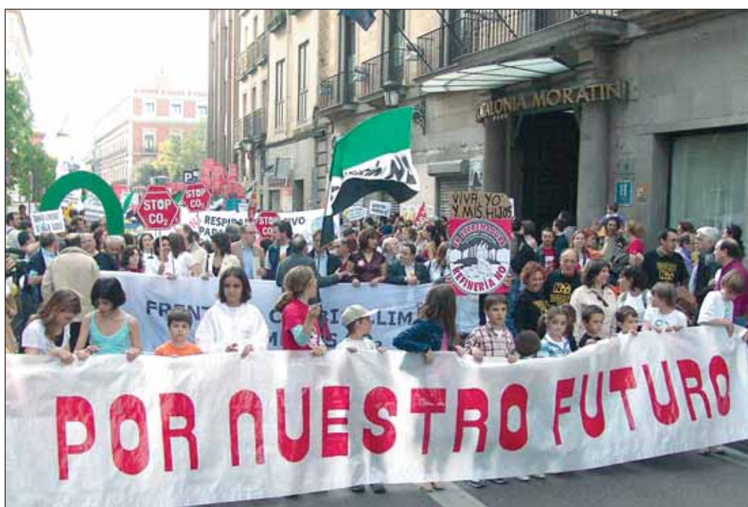
La del 21 ha sido la manifestación más grande contra el cambio climático celebrada en el Estado español.