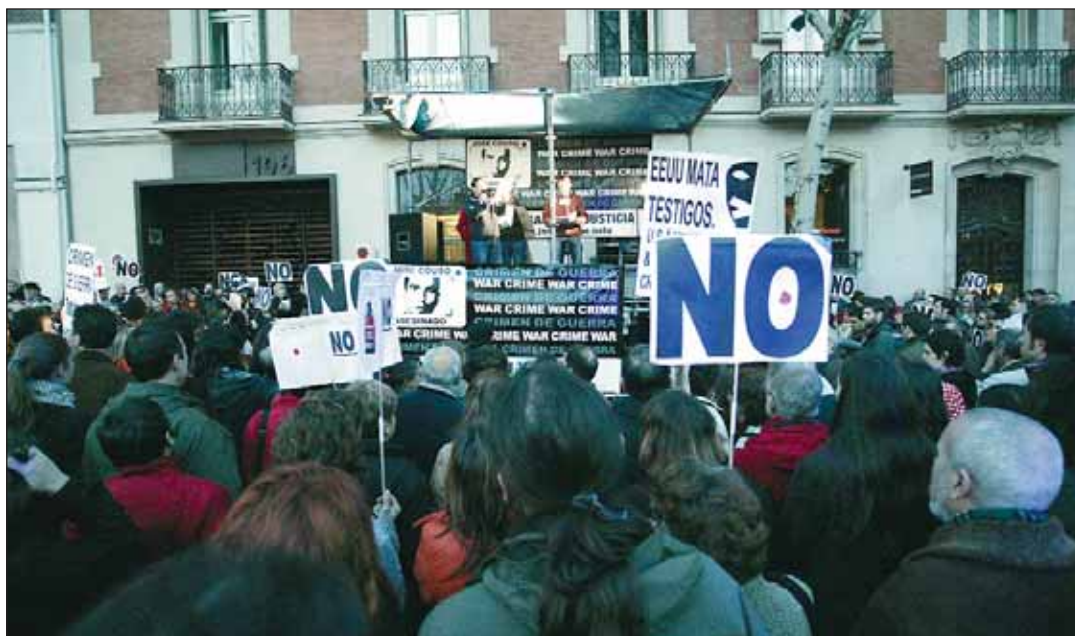
Concentración frente a la Embajada de EEUU en el 4º aniversario de la muerte de Couso.

Coincidiendo con el 4º aniversario de la muerte de Couso, el 8 de abril tuvo lugar una manifestación ante la Embajada de EEUU.