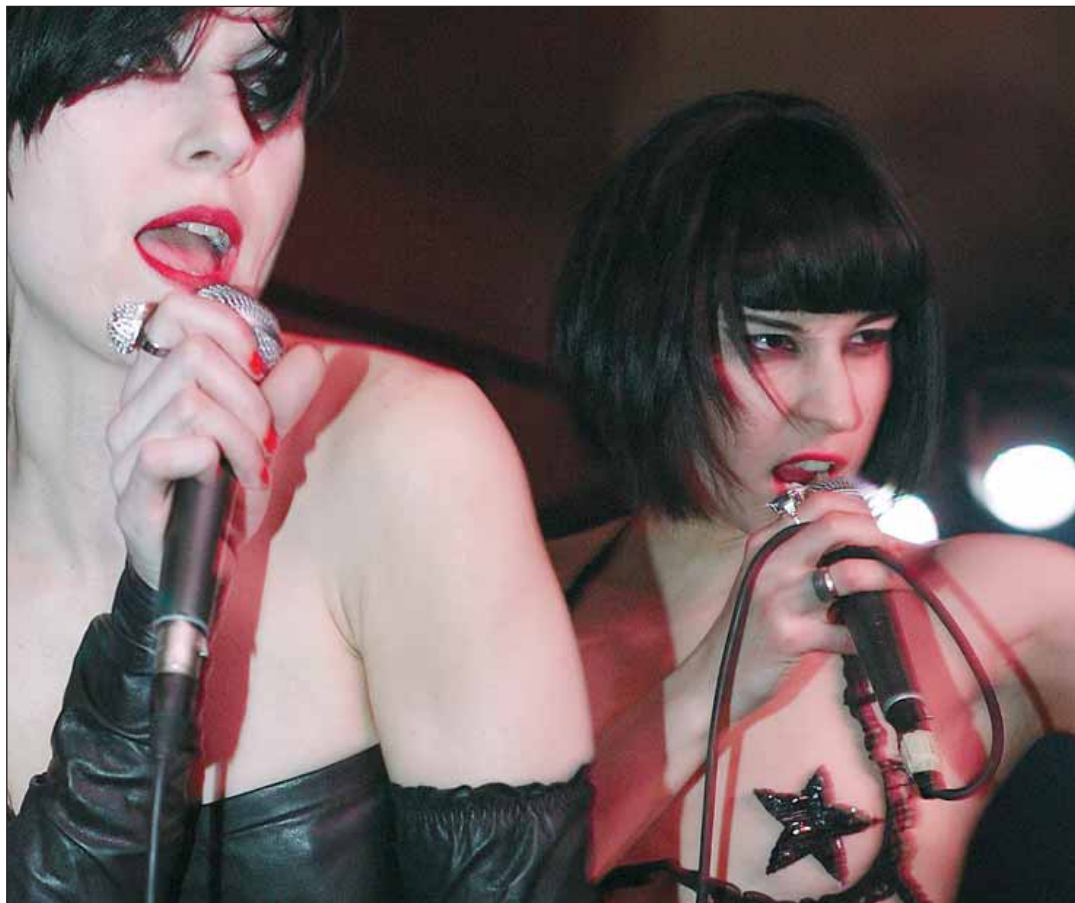
Dirty Princess: sexo y lenguaje duros al son del Techno.

Los siguientes en tocar fueron Delco (estaban anunciados los rap-metaleros La Pan, pero se cayeron del cartel en el último momento), banda madrileña en formato po-