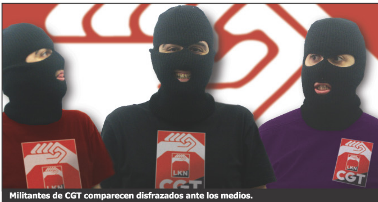
Militantes de CGT comparecen disfrazados ante los medios.

Representamos a una parte importante de trabajadores y no queremos seguir siendo amenazados, extorsionados, coaccionados ni despedidos. No queremos seguir muriendo a diario en accidentes de trabajo porque no se toman las medidas necesarias para evitarlos.