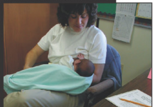
Permiso de paternidad