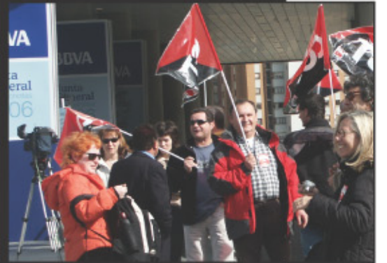
CGT se moviliza en el BBVA