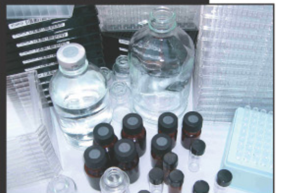
Entramos en Osakidetza