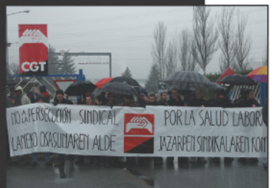
Sin convenio en Volkswagen Navarra