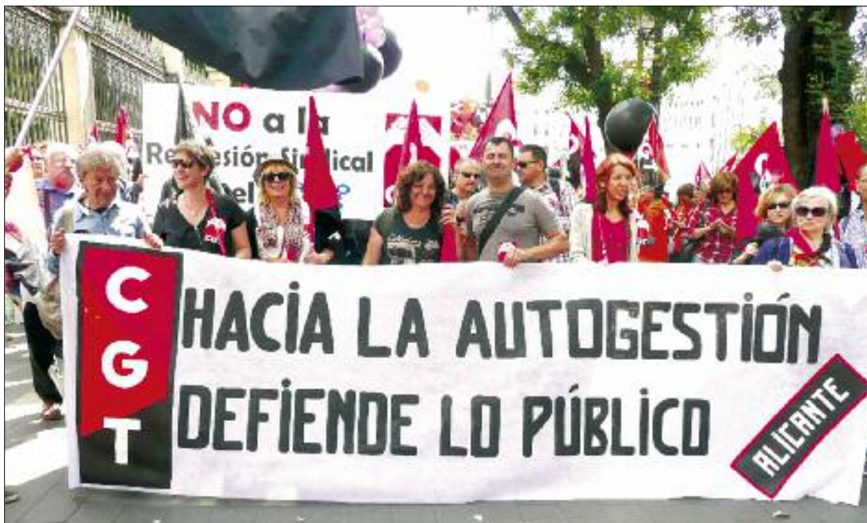
Manifestació de la CGT a Madrid celebrada el 18 de juny En Defensa d'Allò Públic #xLoPúblico18J.