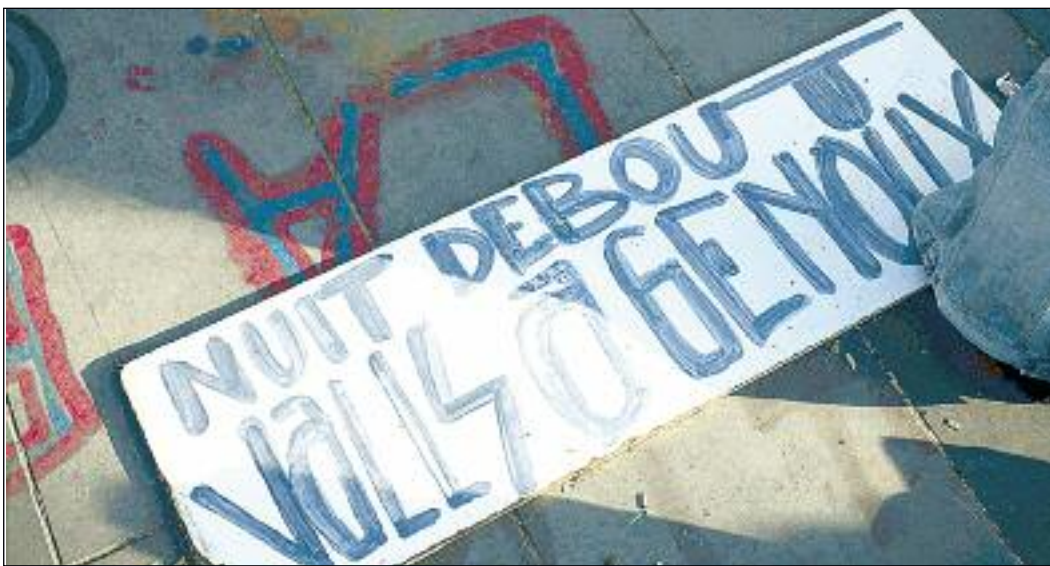
Cartell del moviment Nuit Debout en una plaça de Rennes (Bretanya): Nit en peu, Valls agenollat.

També caldria preguntar-se sobre la capacitat que tenen aquests diferents actors socials per a posar-se d'acord i lluitar junts: i ací,