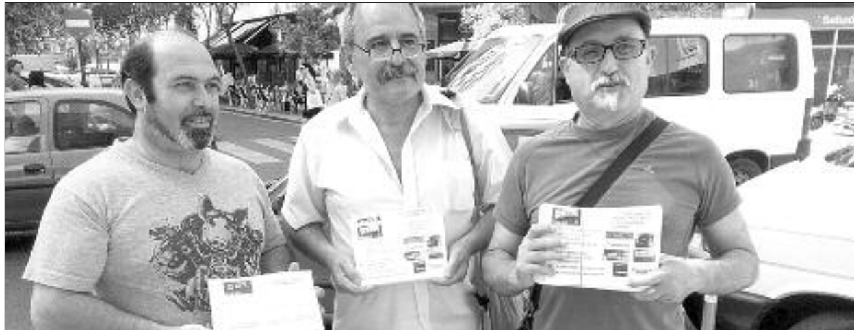
En la foto, un moment del repartiment d'informació al carrer el passat 11 de juliol.

La ONCE está sancionando a sus trabajador@s por no alcanzar un mínimo de ventas, que ella fija, y que cada día son más difíciles de lograr, dándose la triste paradoja de que sancionan al colectivo vendedor por "ven-