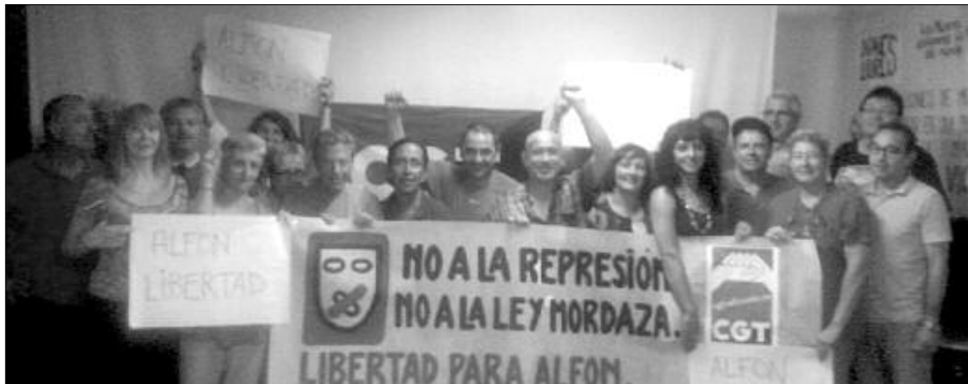
Imatge d'una Plenària de la CGT del País Valencià i Múrcia celebrada en 2014.

SOV de Benidorm C/ San Antonio nº 15 Tel. 96 680 65 80 Fax 96 680 65 80 03501 -Benidorm (Alacant) Apt. Correus 125 (CP: 03501) cgtmarinabaixa@gmail.com