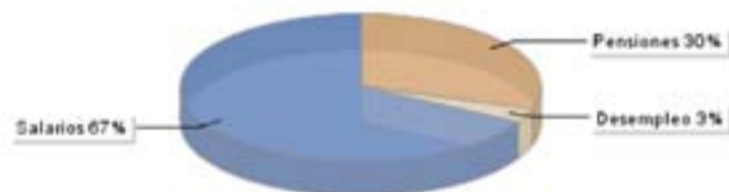
Distribución de los grupos de población