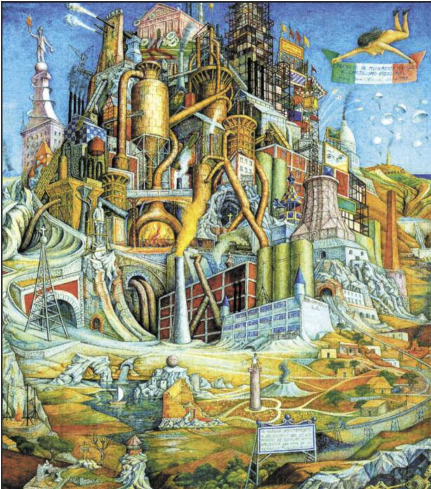
Juan O'Gorman (México, 1905-1982). Monumento fúnebre del capitalismo industrial , 1943. / Temple sobre masonite. Colección Gutiérrez Roldán. México DF

Desde Baladre, CGT y Ecologistas en Acción llevamos muchos años hablando de la Europa del capital, por entender que el corazón de la Unión Europea (UE) es la búsqueda del máximo beneficio, y no la persecución de la justicia, la solidaridad, la libertad o la relación armónica con el entorno. A continuación desglosamos los argumentos que sostienen esta afirmación.