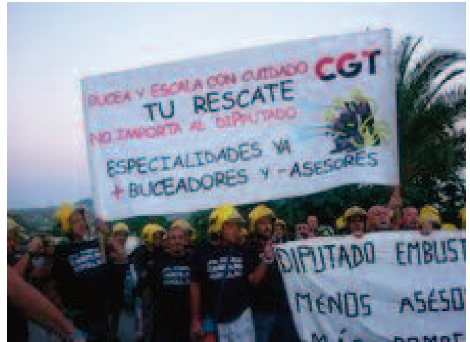
Aspectos de la protesta de Teulada