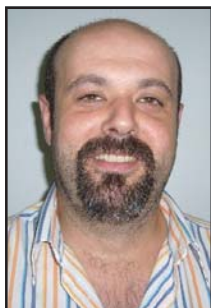
Nico para los amigos 12937 para los directivos

Aunque parezca extraño resulta que desde el 7 de octubre de 2004 los CSS se han de constituir, y registrar en el Departament de Treball como indica el Decreto 399/2004, pero ha sido necesario un cambio de la mayoría en el Comité de Empresa para que esto se haya podido llevar a cabo, ya que el acomodamiento o incapacidad de las anteriores